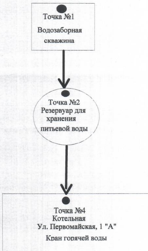
Схема точек отбора проб горячей воды