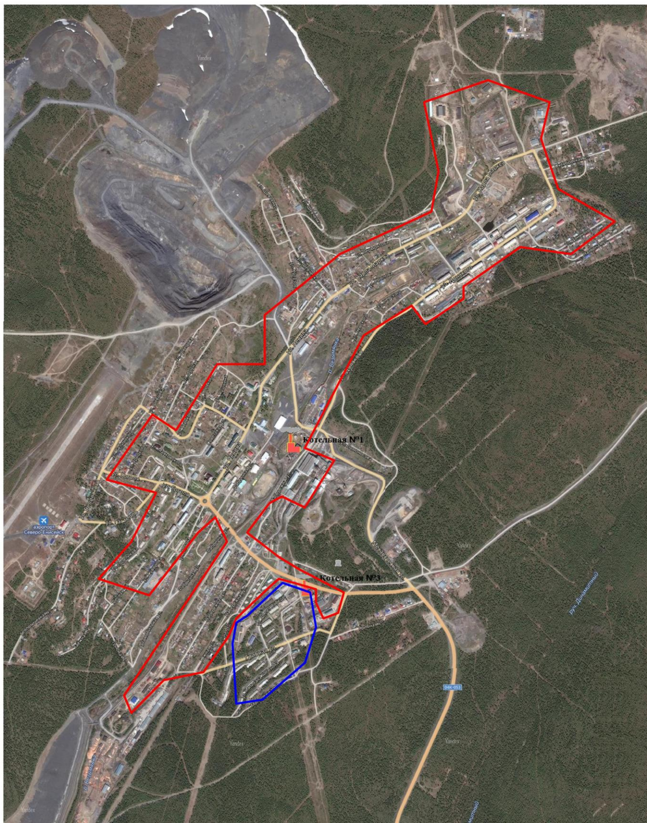
Рисунок 2.1. Существующие зоны действия систем теплоснабжения и источников тепловой энергии гп. Северо-Енисейский