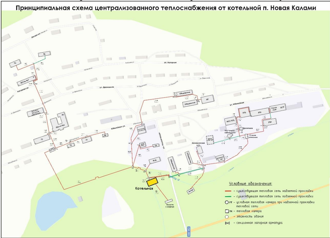
Рисунок 2.1. Существующая зона действия системы теплоснабжения и центра- лизованного источника тепловой энергии п. Новая Калами

Существующая зона действия системы теплоснабжения и централизованного источника тепловой энергии п. Новая Калами представлена на Рисунке 2.1