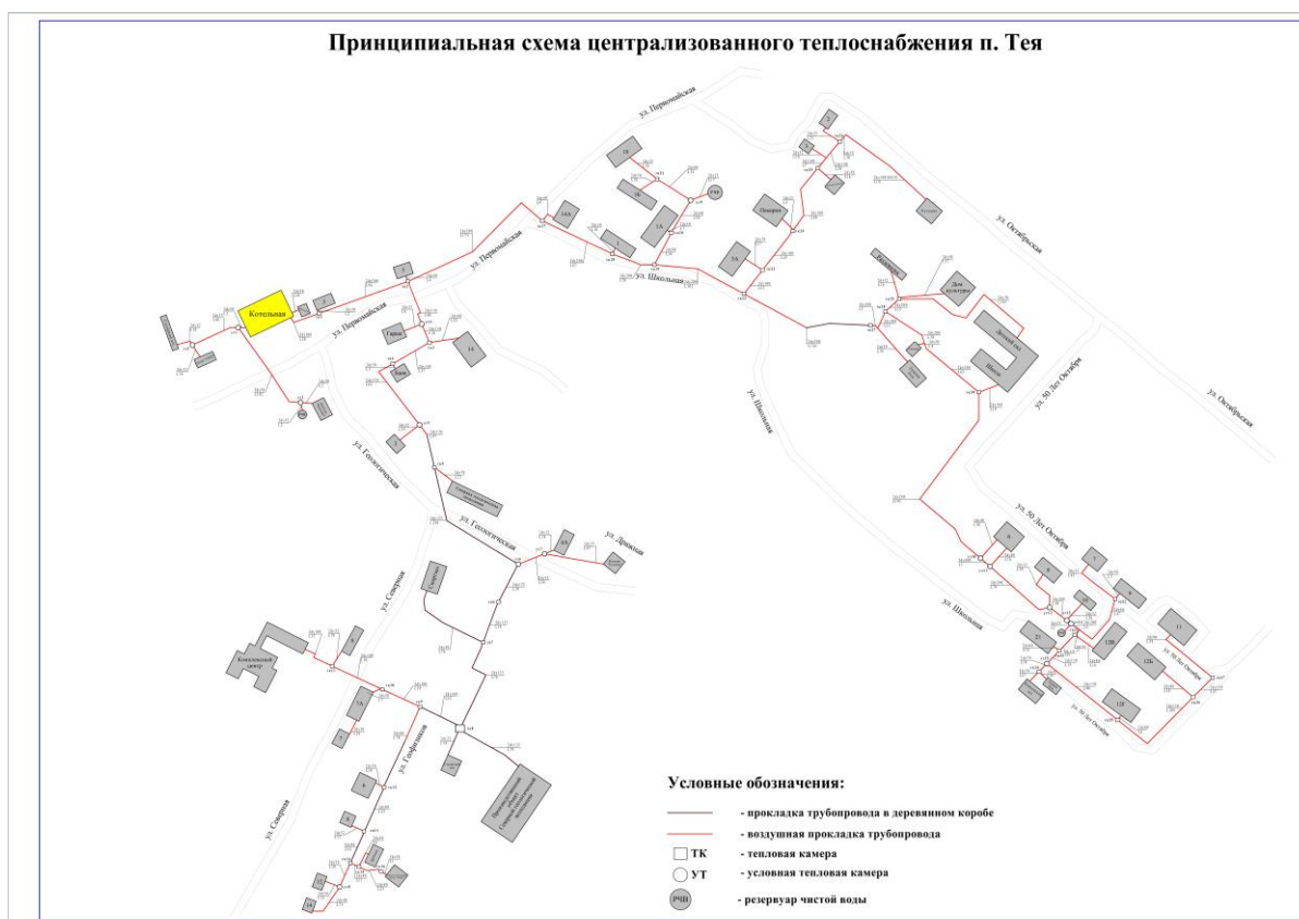
Рисунок 2.1. Существующая зона действия системы теплоснабжения и централизованного источника тепловой энергии п. Тея

Существующая зона действия системы теплоснабжения и централизованного источника тепловой энергии п. Тея представлены на Рисунке 2.1